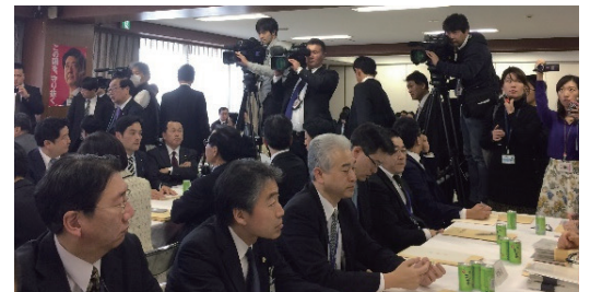
マスコミの注目も高く、出席者も多数！