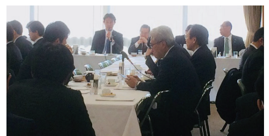
複雑な会議を円滑に進めるのも仕事です。充実した議論の為に力を尽くします！