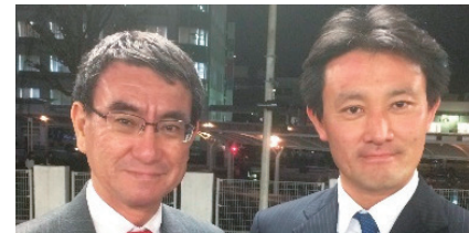
河野外務大臣と 日本の外交を守り抜きます